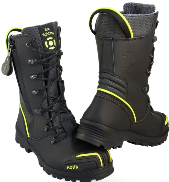
Zlin TX Nomex Black